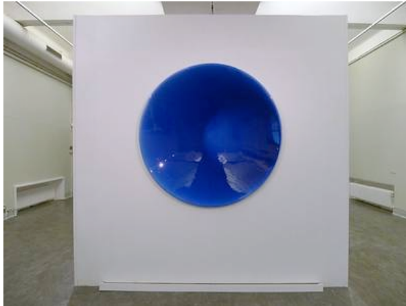
Serina Erfjord: Normal Blue , 2010. Variable mål. Metal, flydende maling, elektromotor

LM: Ja faktisk, men problemstillingen handler jo om at kontrollere et materiale, som egentlig er ukontrollerbart. For at få fem liter flydende oliemaling til at hænge vertikalt på en væg, uden at det løber ned på gulvet, har hun jo eksperimenteret med forskellige rotationshastigheder, parabolens fysiske form, mængden og viskositeten af malingen. Det er jo en teknisk kreativ proces, som man kan forstille sig, ind imellem også har været meget frustrerende for hende med masser af maling, som falder ned på gulvet, inden hun har fundet den rette kombination.