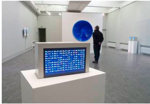
Electrohype 2010, installationsview.