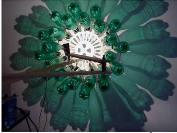
Diane Landry: Mandalas in series Blue Decline , 2002. Variable mål. Plastikflasker, elektromotor, mekaniske dele