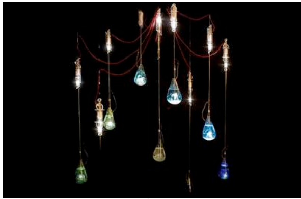
Siwon Jeong: Karat , 2010. Variable mål Væske, glas, lysdioder, krystaller, højtalere.