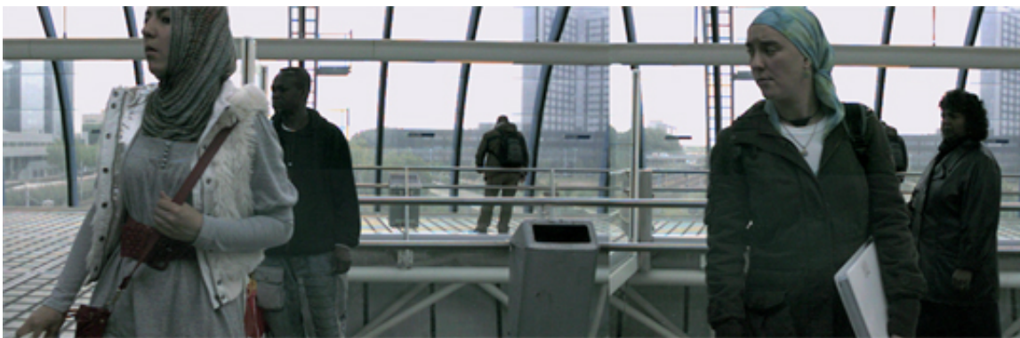
Public Figures av Erik Olofsen.

förutbestämt system tänds och släcks lampor om vartannat, beroende på om deras närmaste omgivning av andra lampor är tända eller släckta. Verket är en påminnelse om att vi är