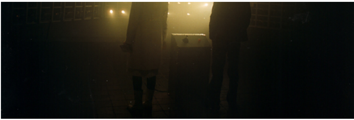
EVIL/LIVE 2 av Bill Vorn.

beroende av varandra och har lämpligt placerats vid den stora glasfasaden. Med sitt glittrande skimmer är den också synlig för betraktare utifrån.