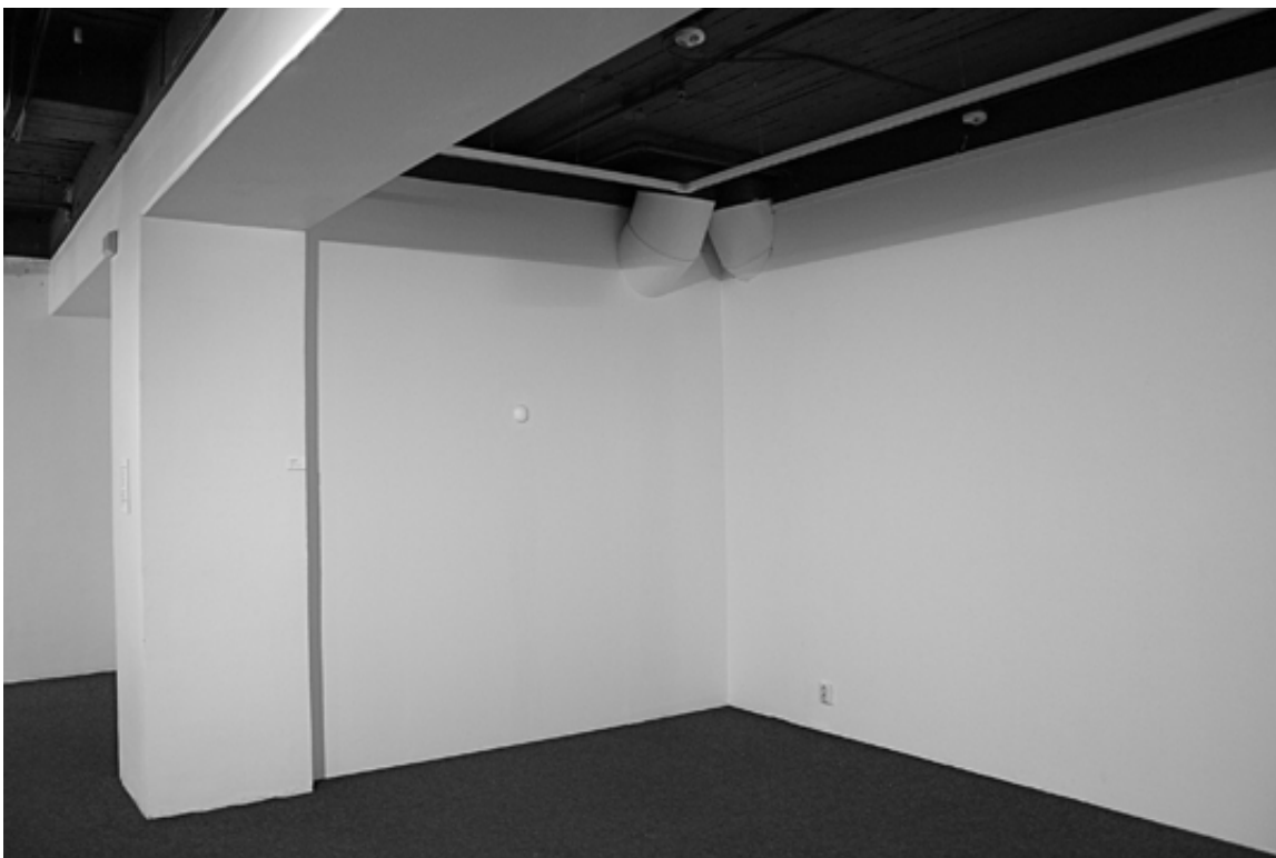
Cold Stain av Serina Erfjord.

Erik Olofsens verk Public Figures (2007) är ett av de mer suggestiva videoverk jag sett på länge som visar samspelet mellan våra privata och offentliga liv.